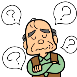
物忘れ ボーっとしている 作業に時間がかかるようになった