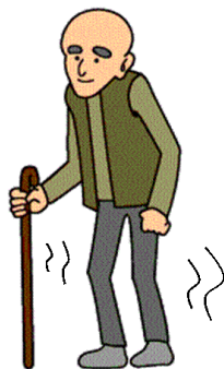
小刻み すり足 転びやすい